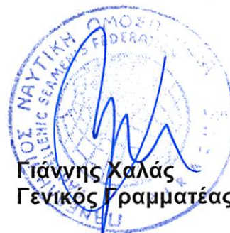
Γιάννης Καλάς Γενικός Γραμματέας ΠΝΟ